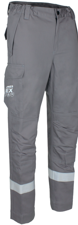
Gris Acier 20