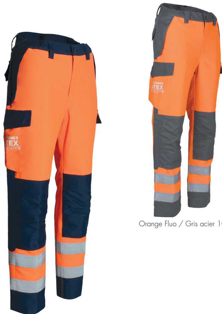
Orange Fluo / Gris acier 104