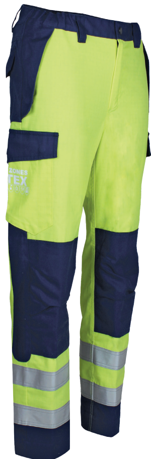
Jaune Fluo / Marine 96