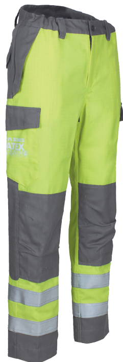
Jaune Fluo / Gris acier 97