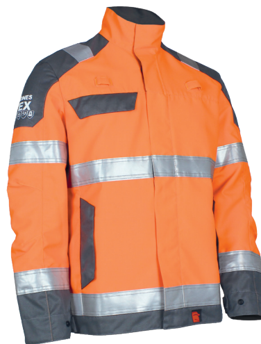
Orange fluo / Gris acier 104