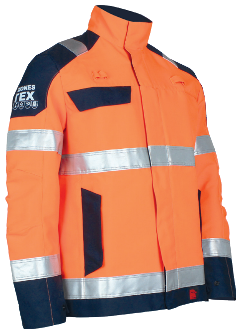
Orange fluo / Marine 100

Col montant fermé • Fermeture à glissière injectée curseur plastique recouverte par patte rapportée fermée • Ceinture fermée et réglable par pattes de serrage latérales • Mercerie plastique • 1 poche poitrine gauche à fermeture à glissière injectée curseur plastique (entrée de poche sous la patte rapportée du blouson) • 1 poche poitrine droite à rabat fermé • 2 poches basses à rabat fermé • Bandes rétro-réfléchissantes ignifuges grises de 5 cm cousues à double couture à double tour de torse et bras et sur les épaules • Couvre-reins • Coudes préformés par 4 pinces piquées • Bas de manches droits réglables avec patte de serrage • 2 passants pour détecteurs sur la poitrine • Rabats plus larges • 1 marquage ATEX sur la manche droite • Fermeture du col, de la patte centrale, des pattes de serrage, de la ceinture et des rabats de poches par boutons pressions cachés en plastique.