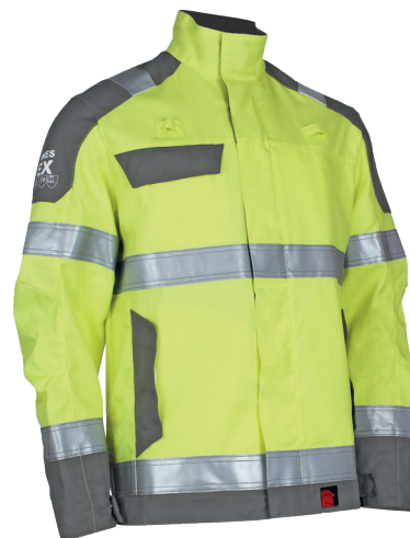
Jaune Fluo / Gris acier 97