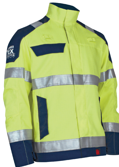
Jaune Fluo / Marine 96

Col montant fermé • Fermeture à glissière injectée curseur plastique recouverte par patte rapportée fermée • Ceinture fermée et réglable par pattes de serrage latérales • Mercerie plastique • 1 poche poitrine gauche à fermeture à glissière injectée curseur plastique (entrée de poche sous la patte rapportée du blouson) • 1 poche poitrine droite à rabat fermé • 2 poches basses à rabat fermé • Bandes rétro-réfléchissantes ignifuges grises de 5 cm cousues à double couture à double tour de torse et bras et sur les épaules • Coudre-reins • Coudes préformés par 4 pinces piquées • Bas de manches droits réglables avec patte de serrage • 2 passants pour détecteurs sur la poitrine • Rabats plus larges • 1 marquage ATEX sur la manche droite • Fermeture du col, de la patte centrale, des pattes de serrage, de la ceinture et des rabats de poches par boutons pressions cachés en plastique.