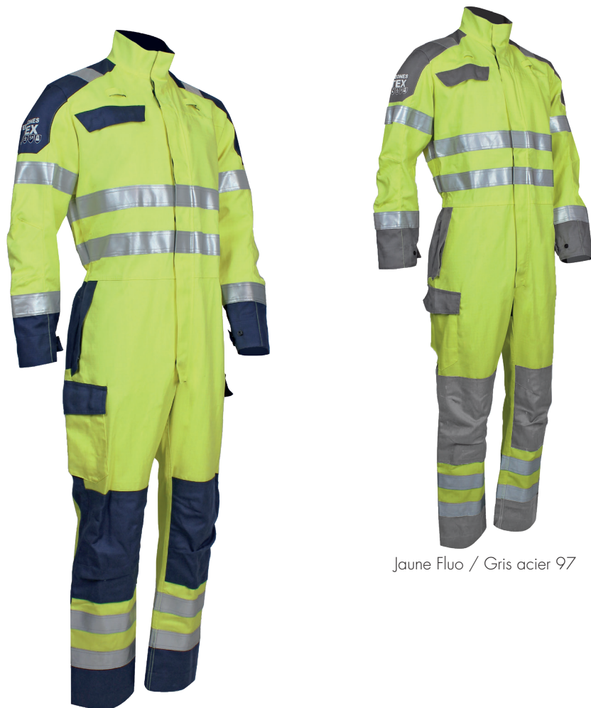
Jaune Fluo / Gris acier 97