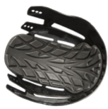
SCARAP2 : Coque rigide et semi pleine